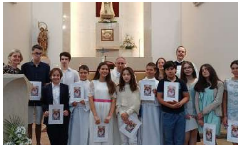
10 de maio | Profissão de Fé