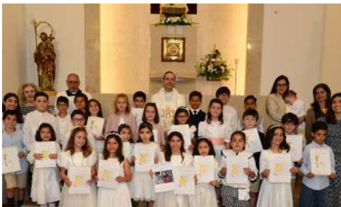
16 de maio | Primeira Comunhão