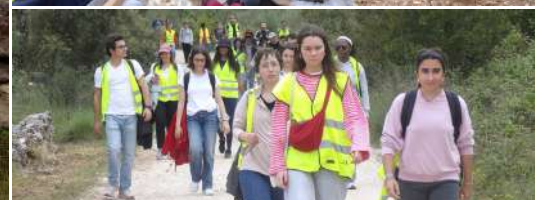
2 de maio | Peregrinação de Minde até Fátima com os grupos de jovens