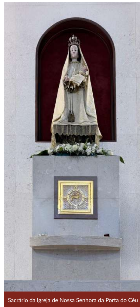
Sacrário da Igreja de Nossa Senhora da Porta do Céu