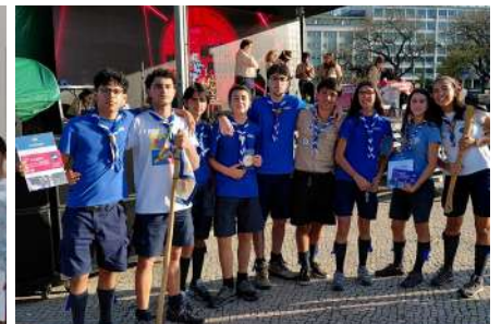
18 de abril | As nossas duas equipas de pioneiros conquistaram 1.º e 2.º lugar no Dia de S. Jorge, atividade que reúne todos os escuteiros de Lisboa