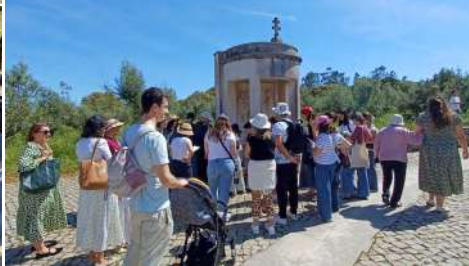
Ida da Catequese a Fátima