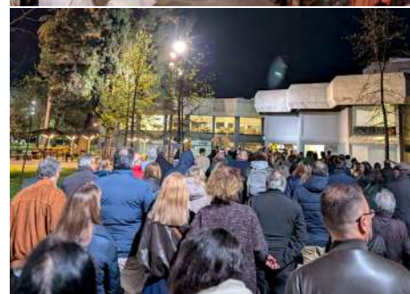
Imagens da já tradicional Via-Sacra Vicarial, no passado mês de março