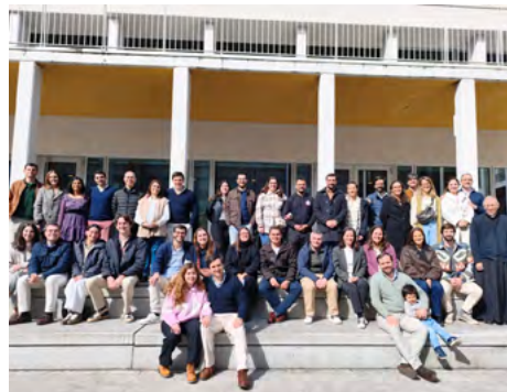
O nosso último curso de noivos, em março.

“O Senhor continua a convidar a segui-Lo, mas também nos convoca para que possamos chamar e convidar em Seu nome pessoas concretas que possam iniciar um percurso de discernimento e de crescimento da vida cristã. Encorajamos-vos, por isso, a que possam fazer chegar estes convites de forma pessoal àqueles rapazes e raparigas que acompanham nas vossas comunidades e a quem estas propostas poderiam ser uma oferta do Espírito para o seu Neste tempo de Quaresma partilhamos convosco algumas