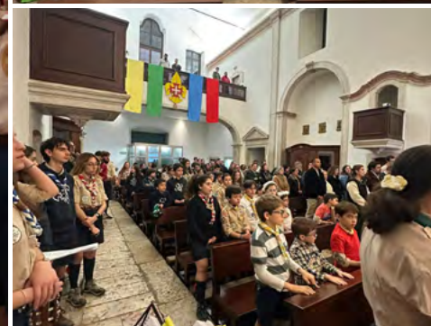
Promessas dos Escuteiros do nosso agrupamento, no dia 14 de março.