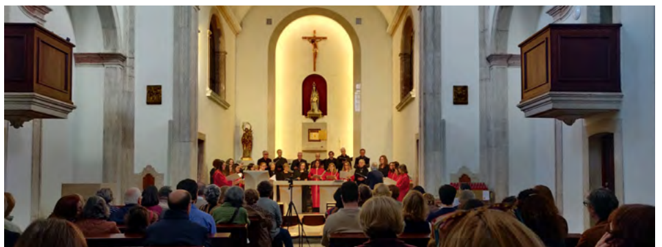
Concerto de Quaresma.

Vaticano, Solenidade de São José, 19 de março de 2026.