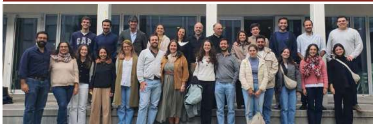
Casais formadores e casais em preparação para o casamento, no novembro passado.