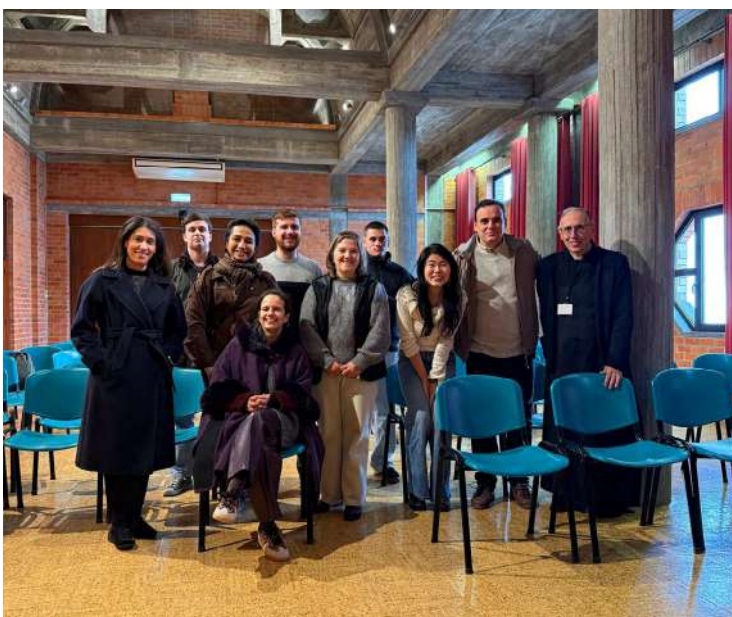
Alguns dos que se preparam para receber os Sacramentos de iniciação cristã, no dia de retiro, no Santuário do Cristo Rei.