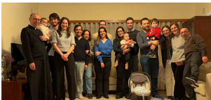
Mais um dos grupos de casais da nossa paróquia.