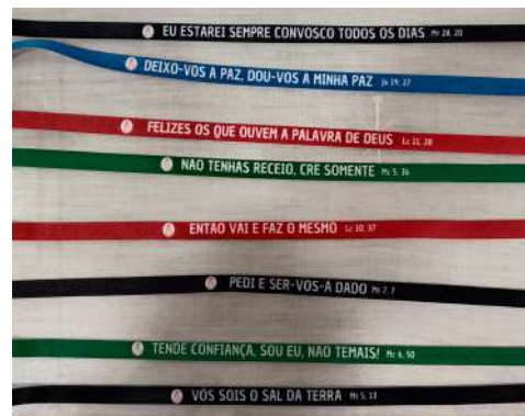
Pulseiras de Jesus, criado pelo Grupo de jovens do secundário. As pulseiras têm 20 frases de Jesus ou a Ele dirigidas, com 4 cores, uma por cada evangelista. É uma proposta para se lembrar da proximidade de Jesus, de O ouvir e conseguir falar mais vezes com Ele durante o dia.