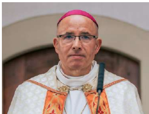
D. Rui Valério Patriarca de Lisboa