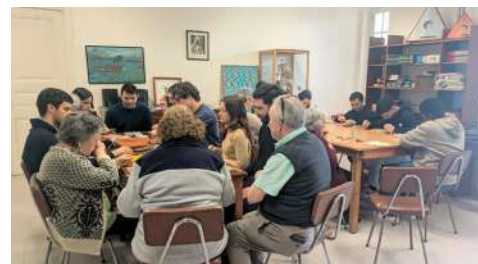
Grupos de jovens: uma tarde com os residentes das Irmãzinhas dos pobres

Neste ano jubilar, procuremos reabilitar e reforçar a grande esperança que o Ressuscitado oferece a cada um, sobretudo na Eucaristia dominical. Quando o domingo for realmente, para cada um, "o dia do Senhor" comprovaremos a eficácia do encontro com Jesus ressuscitado, gerador da "grande esperança".