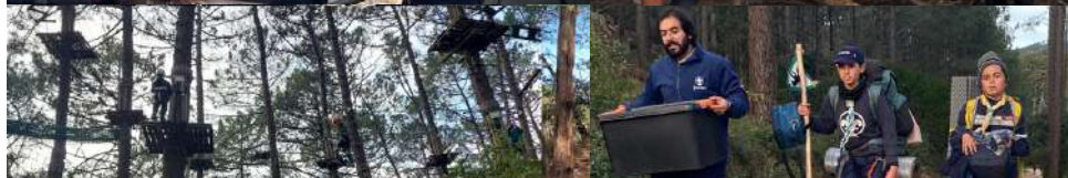
Acampamentos da 2ª e 3ª secção do nosso agrupamento, nos dias 14 e 15.