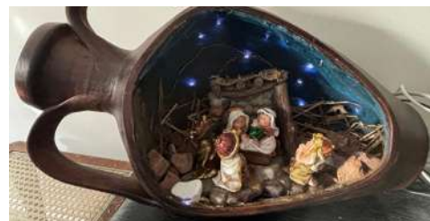
Presépios vencedores do concurso, das famílias da catequese (de cima para baixo: 1º, 2º e 3º lugar).