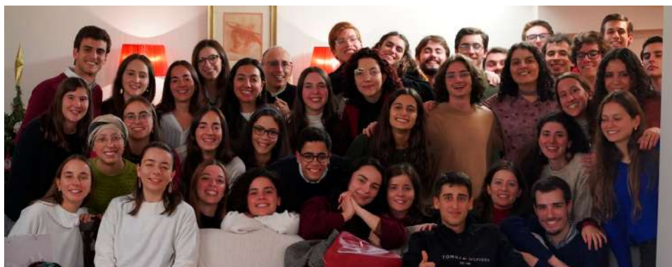
Grupo de jovens universitários: no final do jantar de Natal, dia 21 de dezembro.