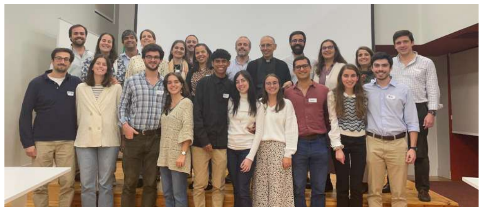
O nosso último curso de preparação para o casamento, em novembro. O próximo será em março.