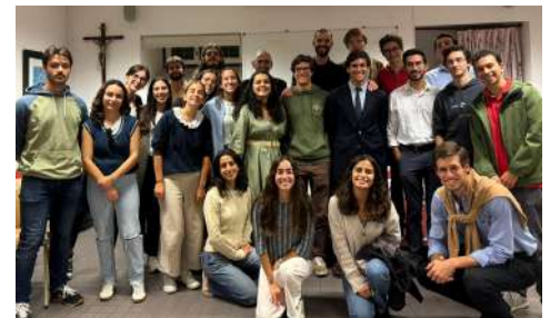
Com um dos nossos convidados no grupo de jovens universitários.