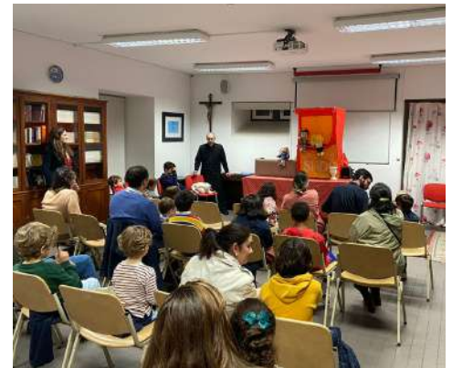
Catequese com marionetas, para crianças muito pequenas e pais.

Peçamos à Sagrada Família de Nazaré que este tempo nos inspire a todos a reproduzir à nossa volta o ambiente salvífico do lar de Nazaré.