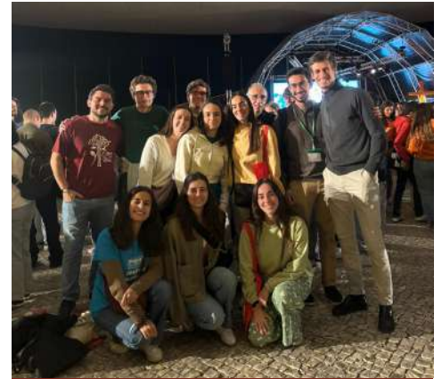
No Rejoice!, depois da Adoração.

No mês de novembro, renovemos a nossa amizade com os santos e contemplemos o Além com as lentes dos que já partiram e agora estão em Deus ou à porta do Céu. Como bons amigos, eles desejam que um dia nos reunamos no Senhor.