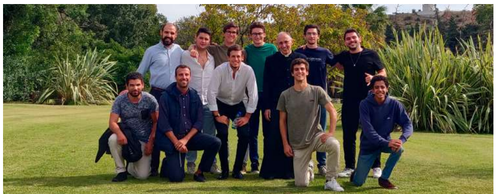
No final do dia de retiro para rapazes dos grupos de jovens, 28 de setembro.