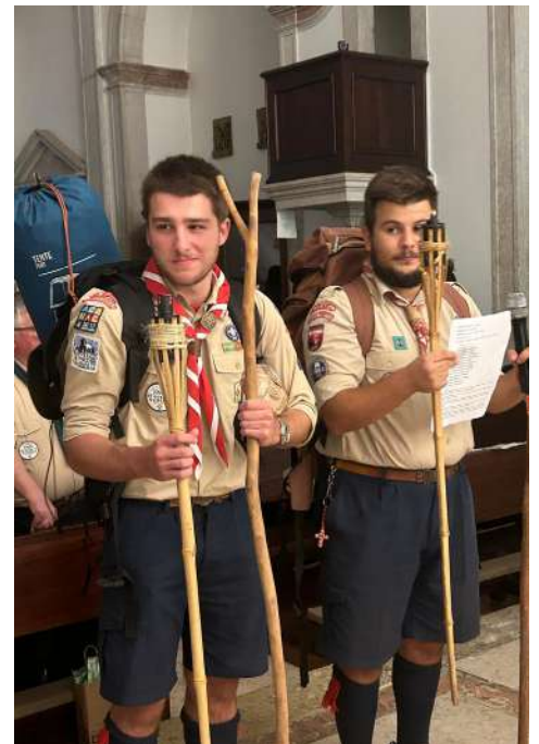
Na Despedida de dois dos Caminheiros do Agrupamento, 18 de outubro.