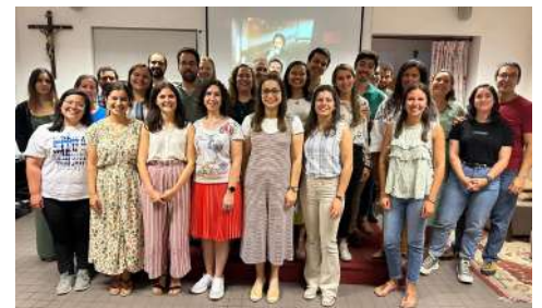
Na última sessão do grupo de profissionais antes das férias. Vimos o filme "Cabrini".