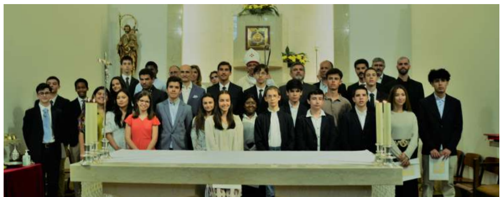
Crisma, 8 de junho de 2024.