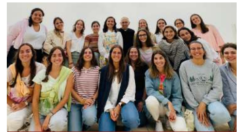
No final do dia de retiro para raparigas dos grupos de jovens, dia 21 de setembro.

Um post scriptum : os adultos também deveriam voltar a ter tempo para aprender as coisas de Jesus... e querer estar com Ele.