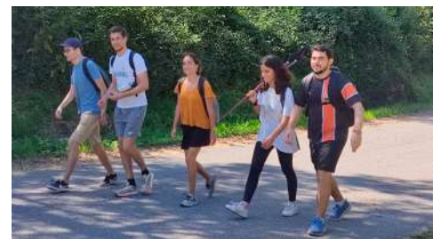
Peregrinação dos grupos de jovens a Santiago, de 23 a 28 de julho