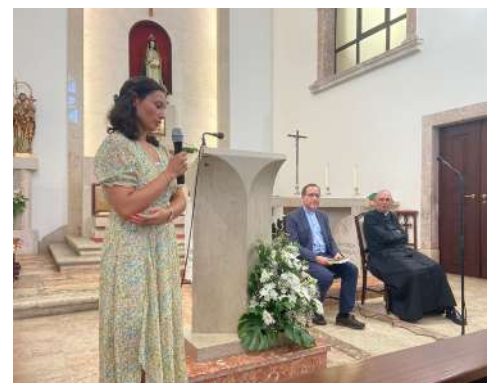
Apresentação do livro "Ao encontro de Jesus", com alguns testemunhos, no dia 19 de julho