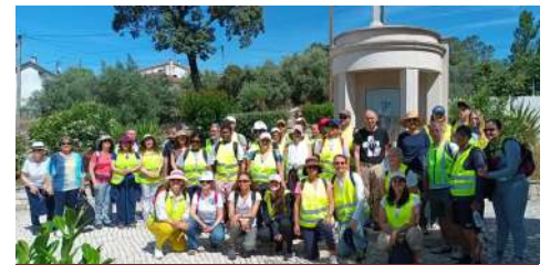
Peregrinação paroquial, dia 22 de junho