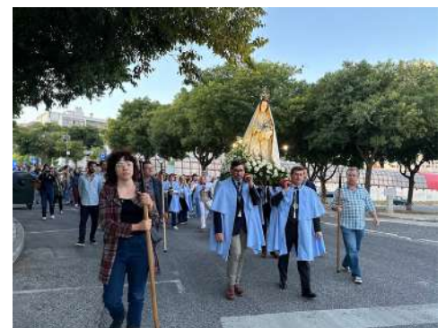
Procissão de Nossa Senhora da Porta do Céu, dia 21 de junho