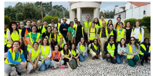
Na peregrinação com os grupos de jovens, no dia 4 de maio