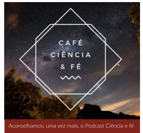
Aconselhamos, uma vez mais, o Podcast Ciência e fé

Peçamos a Jesus, como sugeriu S. Agostinho, que vença também em nós.