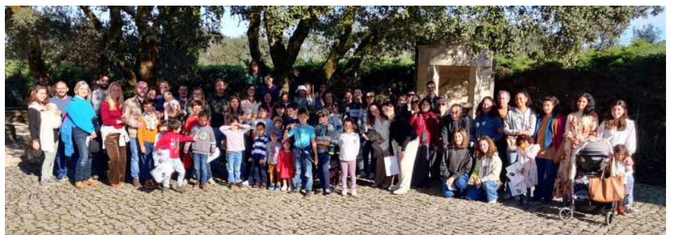
Na Via Sacra nos Valinhos, com a Catequese da Paróquia, no dia 17 de fevereiro