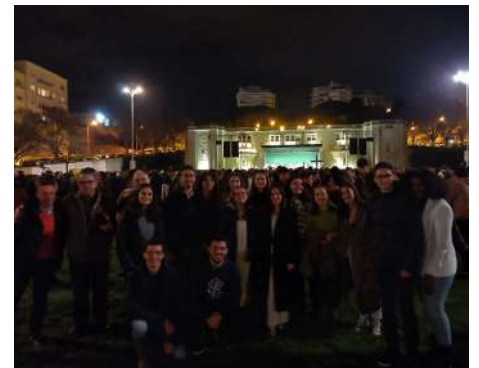
Grupo de jovens universitários: na Via Sacra diocesana, no dia 16 de fevereiro