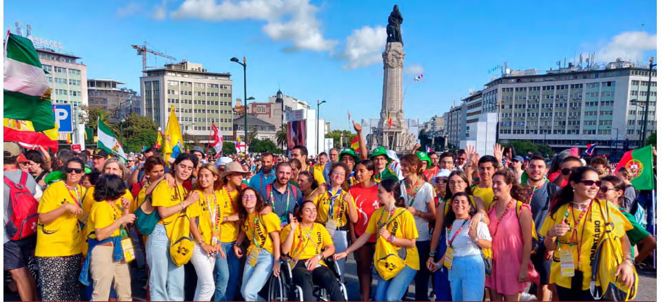
Antes da Missa de abertura presidida pelo Sr. Patriarca.

O Concílio Vaticano II recordou o chamamento universal à santidade: o Evangelho, na sua radicalidade, é para todos. Jesus não propõe a ninguém uma meta menor do que a santidade. Cada um terá a sua vocação e o seu ritmo espiritual, mas seria altamente injusto se um de nós, supostamente em nome de Cristo, dissesse a alguém: no teu caso, não tens de te converter. Jesus não fez isso com ninguém.