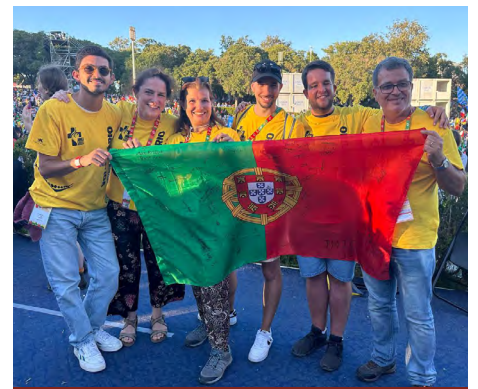
Voluntários da Comunidade surda na JMJ.

A oração universal de cada Eucaristia é um bom momento para abrir os horizontes do nosso coração: unamo-nos sinceramente às diferentes petições de cada oração.