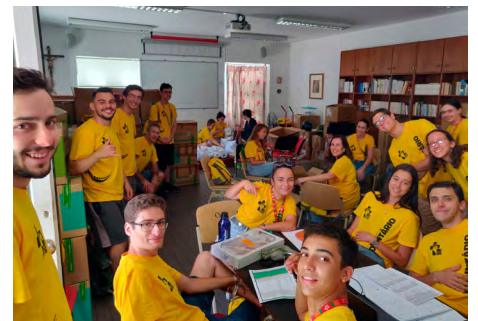
Um dos muitos momentos com alguns dos voluntários da JMJ.