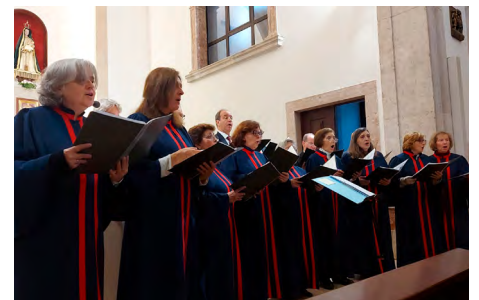
No dia 9 de dezembro, o Coro Santo Inácio esteve na nossa paróquia com cânticos natalícios.