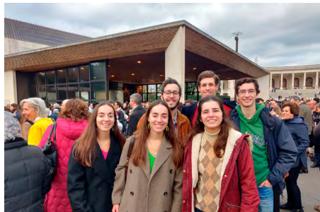
Depois do terço de ação de graças pela JMJ, no dia 1º de dezembro.

Seria péssimo, por exemplo, ver com maus olhos ou falar mal de realidades eclesiais diferentes das que conhecemos bem, sem sequer admitir que o Espírito Santo as possa ter inspirado. Há diferenças saudáveis e enriquecedoras para toda a Igreja. Por outro lado, minariámos a unidade se perdéssemos de vista a realidade da Igreja Universal e nos esquecéssemos de que «há um só Senhor, uma só fé, um só Batismo» (Ef 4,4). Neste sentido, derivas doutrinárias, irresponsáveis e desobedientes criatividade litúrgicas, gestos ou palavras de desunião ao Papa, não são, garantidamente, obra do Espírito Santo. Rezemos, pois, pela unidade da Igreja.