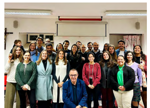
Grupo de jovens profissionais no final do jantar de Natal.