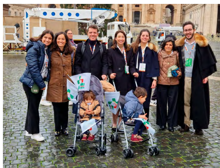
Participantes da JMJ da paróquia, depois do encontro com o Papa em Roma, 30 de novembro.