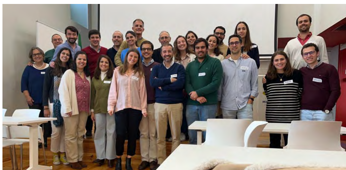
Curso de preparação para o casamento, em novembro. O próximo será em março.

Relembro o que disse o Papa Francisco aos voluntários da JMJ, na tarde do encantador domingo de 6 de agosto: "Renovar dia a dia o encontro pessoal com Jesus é o coração da vida cristã. E deve ser renovado todos os dias para manter vivo o desejo do mesmo não só na cabeça, mas também no coração." No advento, cultivemos a necessidade que todos temos do Senhor. Seria um advento bem vivido se no dia do Nascimento rezássemos do fundo do coração: continuamos todos a precisar de Ti, Jesus!