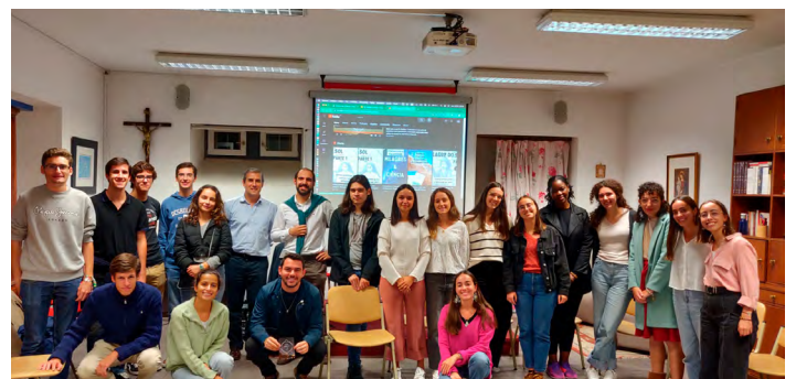
Uma sessão muito interessante com dois engenheiros sobre o Milagre do Sol.