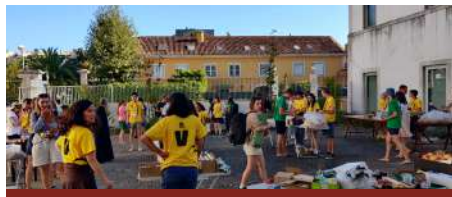
Recordando a JMJ: os pequenos-almoços para 2000 peregrinos, às 7h00 da manhã...

Recordo-me da grande festa que reinava no campus universitário naquela manhã, e na que se fazia por toda a cidade. Nos grupos que rezavam sem vergonha o terço, nas Igrejas abertas 24 horas por dia, nas missas cheias. Tantos jovens, e nenhum com medo de se dar a conhecer como católico. “As respostas fáceis anestesiaram”, dizia o Papa neste encontro. E como anestesia uma juventude fácil, de playstation, sem doação, sem grandes ideais! Ao recordar-me da JMJ, pensava “Como é que tantos jovens conseguem olhar para isto e dizer “Não quero”? Depois pensei: muitos veem o ser cristão como uma adesão a uma ideologia, quase como que a um partido político. Há uma filiação e um conjunto de regras, muitas obrigações, algumas regalias. Mas não. O cristianismo, como experimentamos na JMJ, não é uma ideologia. O cristianismo é uma Pessoa, é Cristo.