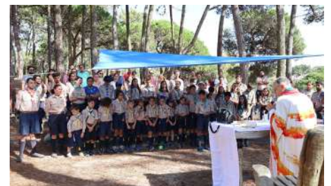
Crismas na nossa paróquia, no passado mês de junho.