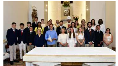
Missa com o nosso agrupamento do CNE, no mês de setembro, em Janas.