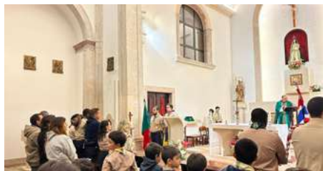
Promessa dos escuteiros do nosso agrupamento, no dia 25 de março.

«Uma pressa boa impele-nos sempre para alto e para o outro. Mas há também uma pressa não boa, como, por exemplo, a pressa que nos leva a viver superficialmente, tomar tudo levemente sem empenho nem atenção, sem nos envolvermos verdadeiramente no que fazemos; a pressa de quando vivemos, estudamos, trabalhamos, convivemos com os outros sem colocarmos nisso a cabeça e menos ainda o coração. Pode acontecer nas relações interpessoais: na família, quando nunca ouvimos verdadeiramente os outros nem lhes dedicamos tempo; nas amizades, quando esperamos que um amigo nos faça divertir e dê resposta às nossas exigências, mas, se virmos que ele está em crise e precisa de nós, imediatamente o evitamos e procuramos outro; e mesmo