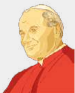
São João Paulo II

Prosseguimos com breves biografias dos Santos Patronos da JMJ (transcrita do site oficial da JMJ 2023).