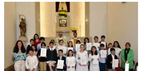
Primeira comunhão das crianças da nossa Paróquia, no dia 22 de abril.

O mês de maio convida-nos a olhar para Maria e a passar mais tempo com Ela para aprender o que é uma «boa pressa». Para isso, proponho que todos rezemos o terço sem pressa, com o sossego interior que facilita deter o olhar em Jesus e em Maria. À luz da vida do seu Filho, Ela ajudar-nos-á a discernir o que são «boas pressas».