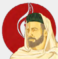
São João de Brito

Prosseguimos com breves biografias dos Santos Patronos da JMJ (transcrita do site oficial da JMJ 2023).