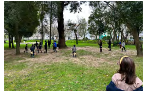
No dia do 45º aniversário do nosso agrupamento de escuteiros: atividades no Campo Grande.