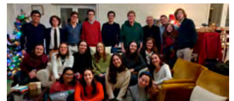
Grupo de universitários: jantar de Natal