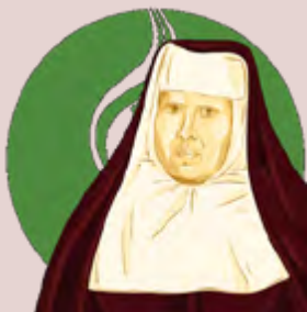
Beata Maria Clara do Menino Jesus

Proseguimos com breves biografias dos Santos Patronos da JMJ (transcrita do site oficial da JMJ 2023).