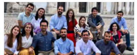
Grupo de jovens profissionais: passeio a Santarém

Entretanto, neste mês de janeiro, na semana do oitavário pela unidade dos cristãos (18 a 25), rezemos intensamente por esta intenção.