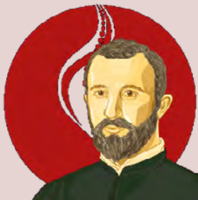
Beato João Fernandes

Prosseguimos com breves biografias dos Santos Patronos da JMJ (transcrita do site oficial da JMJ 2023).