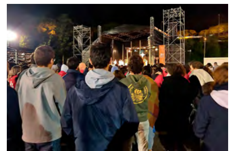
Com alguns dos jovens da nossa paróquia na Vigília de Oração da Jornada Diocesana da Juventude, no passado dia 19 de novembro.

Desse modo, talvez vivamos melhor a preparação para o Natal pois, de facto, do que se trata é de aprender a receber melhor Deus na nossa vida. Dar-Lhe mais espaço. Prestar-Lhe mais atenção. Adaptar a nossa rotina à Sua amável presença.